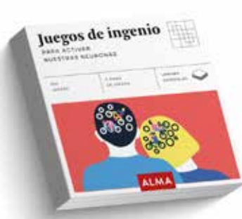
978-84-15618-92-8 Para activar nuestras neuronas