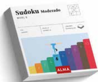
978-84-15618-90-4 Moderado, Nivel 5