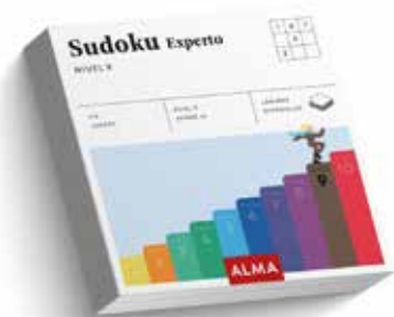
978-84-15618-93-5 Experto, Nivel 9