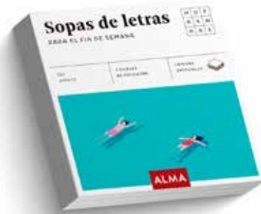
978-84-9068-082-7 Para el fin de semana