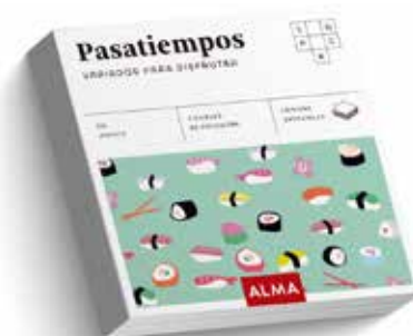
978-84-9068-085-8 Variados para disfrutar