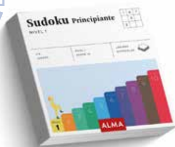
978-84-17430-02-3 Principiante, Nivel 1