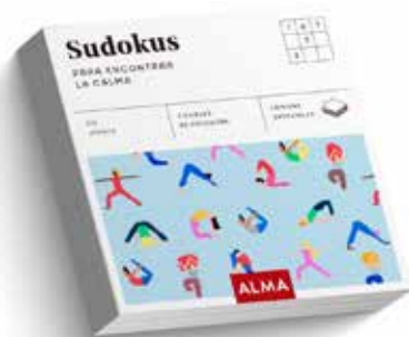
978-84-9068-081-0 Para encontrar la calma