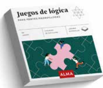
978-84-17430-11-5 Para mentes maravillosas