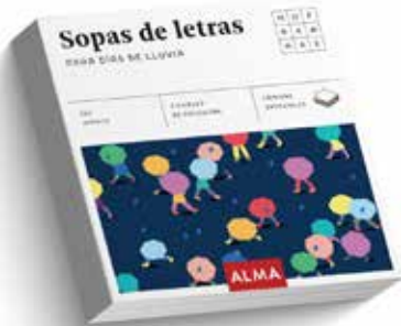
978-84-15618-96-6 Para días de lluvia