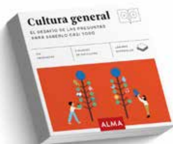
978-84-15618-94-2 El desafío de las preguntas para saberlo casi todo