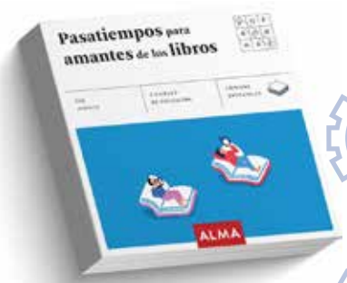
978-84-15618-97-3 Para amantes de los libros