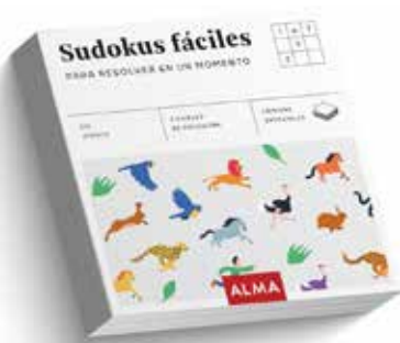
978-84-15618-98-0 Para resolver en un momento