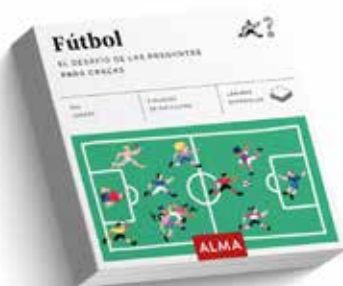
978-84-17430-00-9 El desafío de las preguntas para cracks