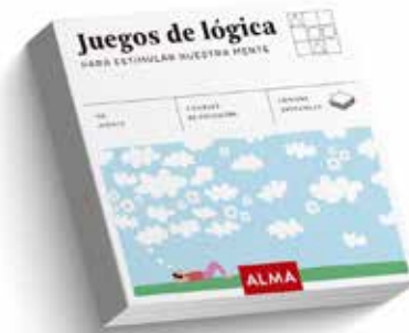
978-84-9068-094-0 Para estimular nuestra mente