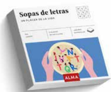
978-84-15618-91-1 Un placer de la vida