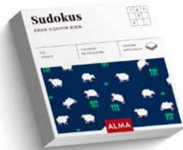
978-84-9068-080-3 Para dormir bien