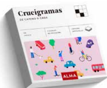
978-84-9068-084-1 De camino a casa