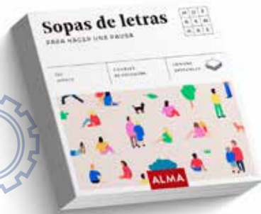
978-84-9068-083-4 Para hacer una pausa