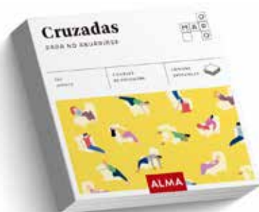
978-84-9068-093-3 Para no aburrirse